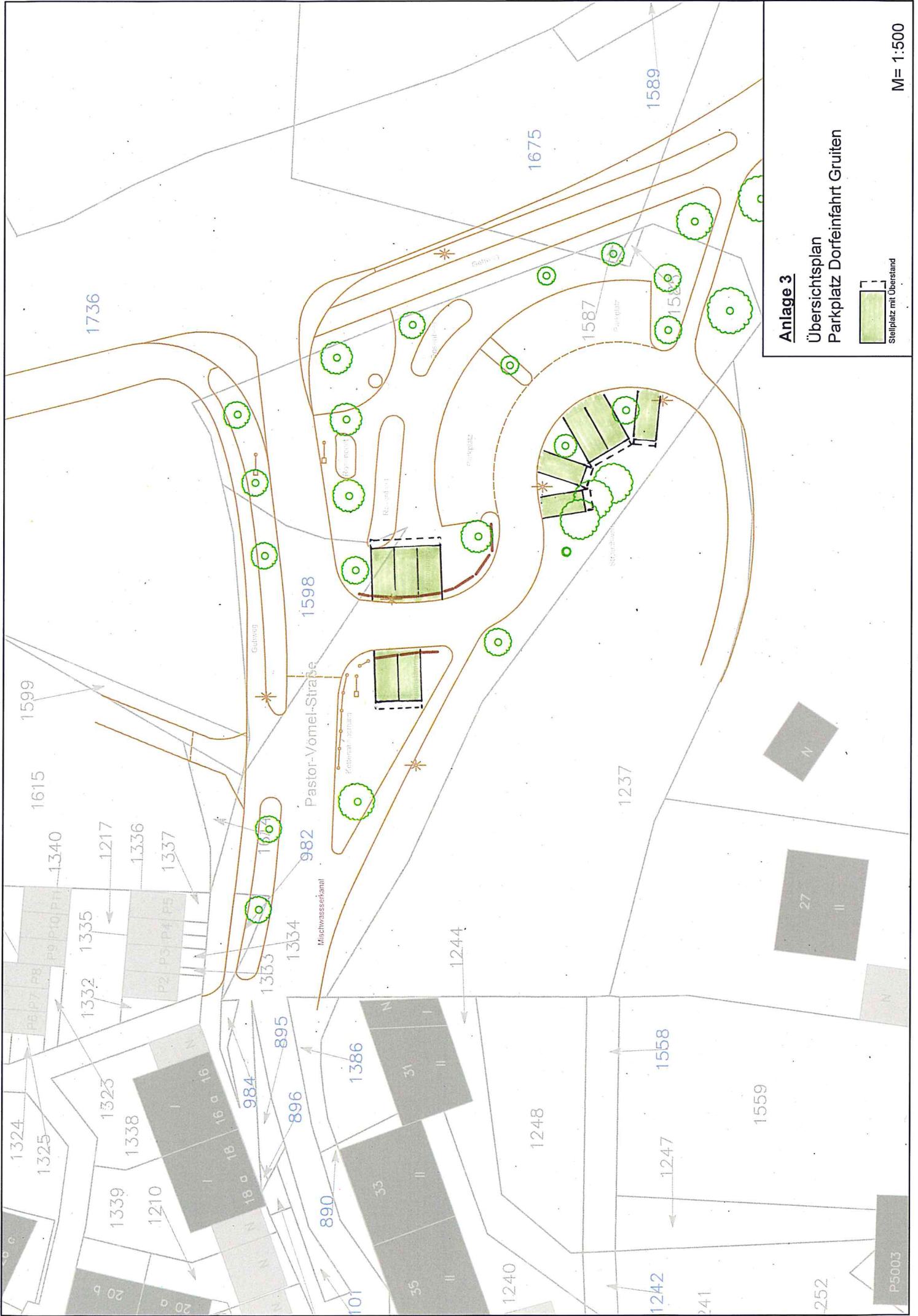
Anlage 3 Übersichtsplan Parkplatz Dorfweinfahrt Gruitzen