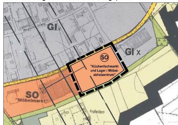
Abbildung 1: FNP-Bestand / 28. Änderung des FNP "Landstraße"