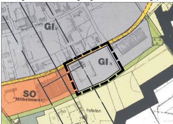
Auszug aus dem bisher gültigen Flächennutzungsplan