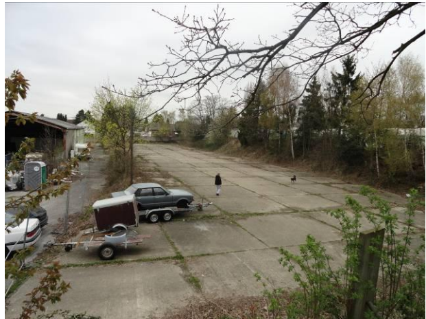
Abb. 7 (li.) – Stellplätze des LKW-Gebrauchtfahrzeughandel an der Düsseldorfer Straße