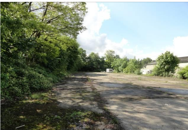
Abb. 8 (re.) – versiegelte Fläche zwischen dem Hallenbereich und dem LKW-Gebrauchtfahrzeughandel