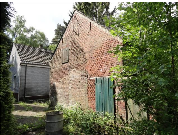
Abb. 14 (re.) – leer stehendes Wohnhaus mit Gartenansicht Erikaweg Nr. 6