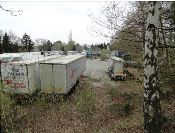
Abb. 6 (re.) – vollversiegelte Lager- bzw. Stellplatzfläche vor dem südlichen Hallenbereich