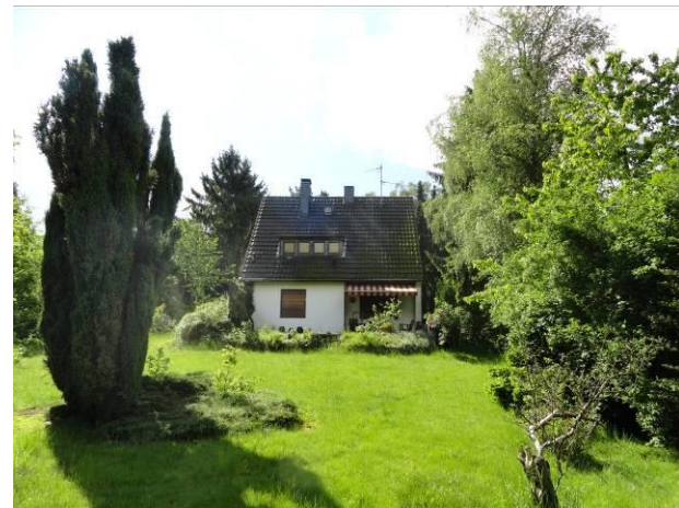
Abb. 13 (li.) – leer stehendes Wohnhaus Erikaweg Nr. 4