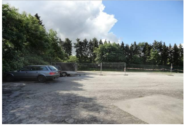
Abb. 5 (li.) – Gewerbehalle mit davor liegender „Lagerfläche“ im südlichen Hallenbereich