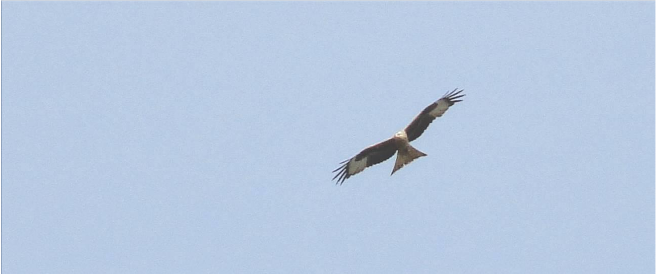
Abb. 18 – Mäusebussard im Überflug des Friedhofs / Erikaweg (24.05.2013 / ISR)

lediglich durch einen Mäusebussard im Überflug des Plangebietes im Bereich Waldfriedhof / Erikaweg nachgewiesen werden.