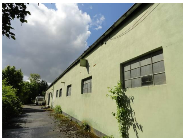
Abb. 2 (li.,re.) – vollversiegelte Gewerbefläche angrenzend zur Düsseldorfer Straße