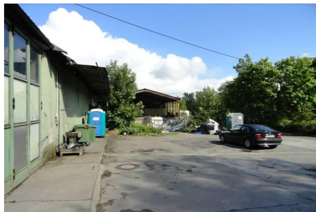
Abb. 3 (li.) – zentrale Gewerbefläche / westliche Hallenseite in Blickrichtung Süden