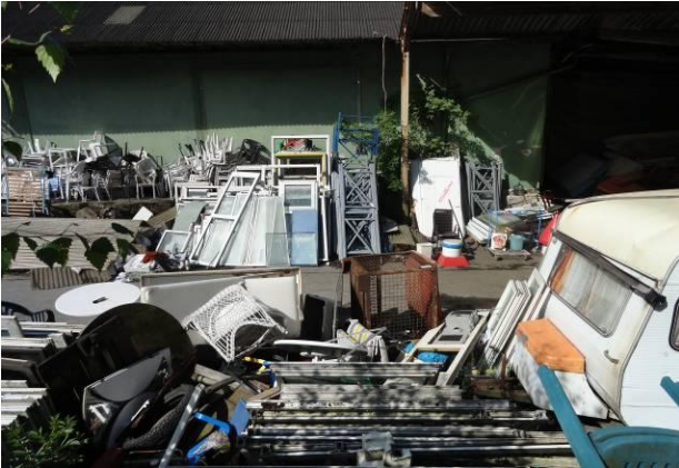
Abb. 4 (re.) – vollversiegelte Gewerbefläche / östliche Hallenseite in Blickrichtung Norden