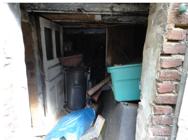
Abb. 15 (li.) – rückwärtiger Schuppen mit Brandschaden - Wohnhaus Erikaweg Nr. 4