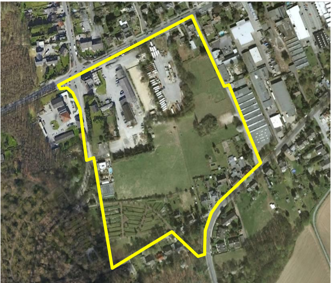
Abb. 1 – Luftbild mit Lage des Plangebietes

Das Plangebiet liegt im Westen der Stadt Haan und wird eingefasst von der Leichlinger Straße im Westen, der Düsseldorfer Straße im Norden, bestehenden Gewerbeflächen im Osten sowie der Ohligser Straße bzw. dem Erikaweg im Süden. Die konkrete Abgrenzung des räumlichen Geltungsbereiches ist der Planzeichnung zu entnehmen.