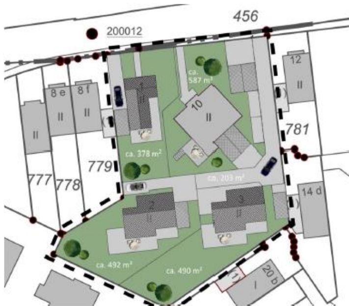
Abb. 3: Bauungskonzept Variante 1