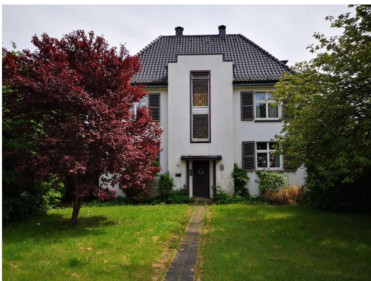
Abb. 2: Bestandsobjekt Steinkulle 10

Der zu überplanende Bereich ist Bestandteil des ehemaligen Guts Steinfeld. Das Wohngebäude (s. Abbildung 2), welches im Norden des Plangebietes liegt, wurde Mitte der 1930er-Jahre neu gebaut. Mitte der 1960er-Jahre wurde zwischen ehemaligem Stall (südlicher Gebäudeteil) und Wohnhaus ein Anbau auf Stelzen (mittlerer Gebäudeteil) errichtet. Auf dem Stall-Gebäude wurde eine Terrasse hergestellt, unter dem Anbau Parkmöglichkeiten geschaffen.