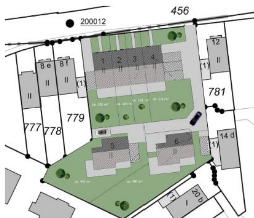
Abb. 4: Bauungskonzept Variante 2

In der Sitzung am 10.04.2018 präferierte der Ausschuss die Variante 1, d.h. den Erhalt des Wohnhauses aus den 1930er-Jahren aus. Auch die anwesenden Bürgerinnen und Bürger sprachen sich im Rahmen der Diskussionsveranstaltung am 04.09.2018 für einen Erhalt aus.