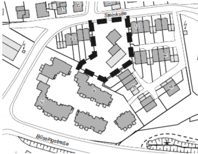
Abb. 1: Geltungsbereich

Das Plangebiet (Gemarkung Haan, Flur 35) umfasst das Flurstück 780. Die Gesamtfläche des Plangebiets beträgt ca. 2.140 qm. Die Abgrenzung des Geltungsbereichs ist in Abb. 1 dargestellt.