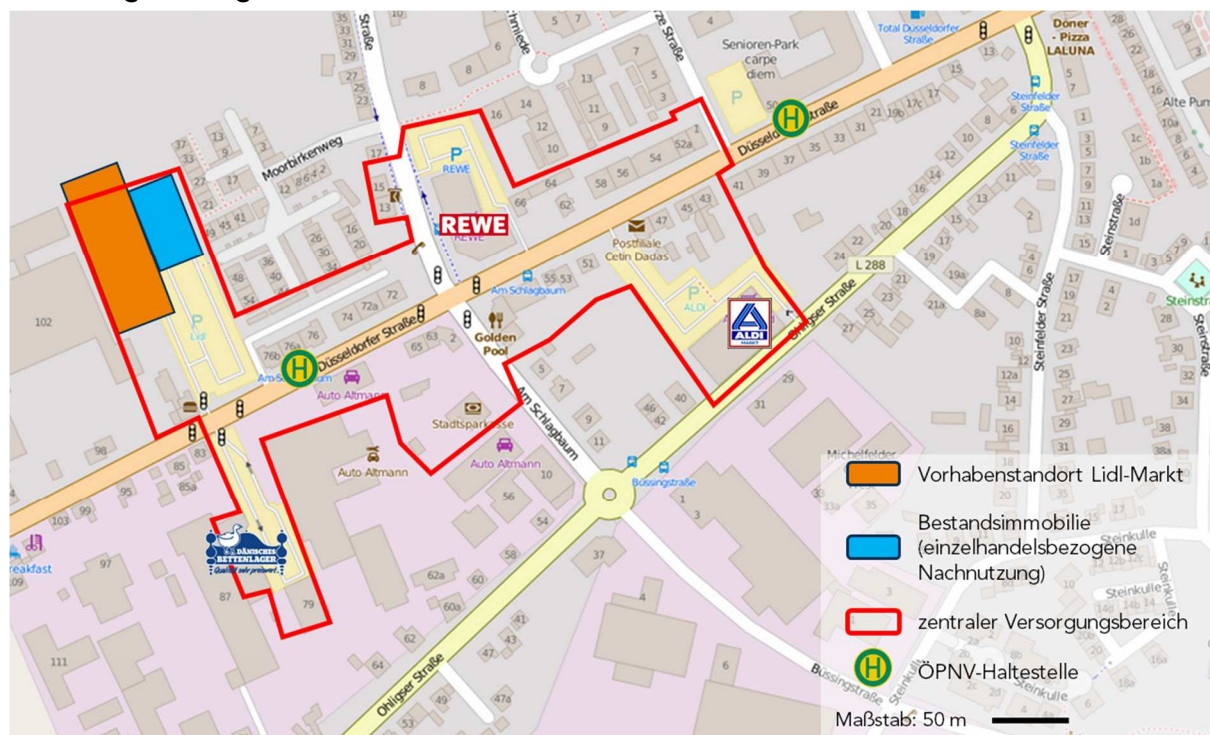
Abbildung 2: Lage des Vorhabenstandortes in Haan