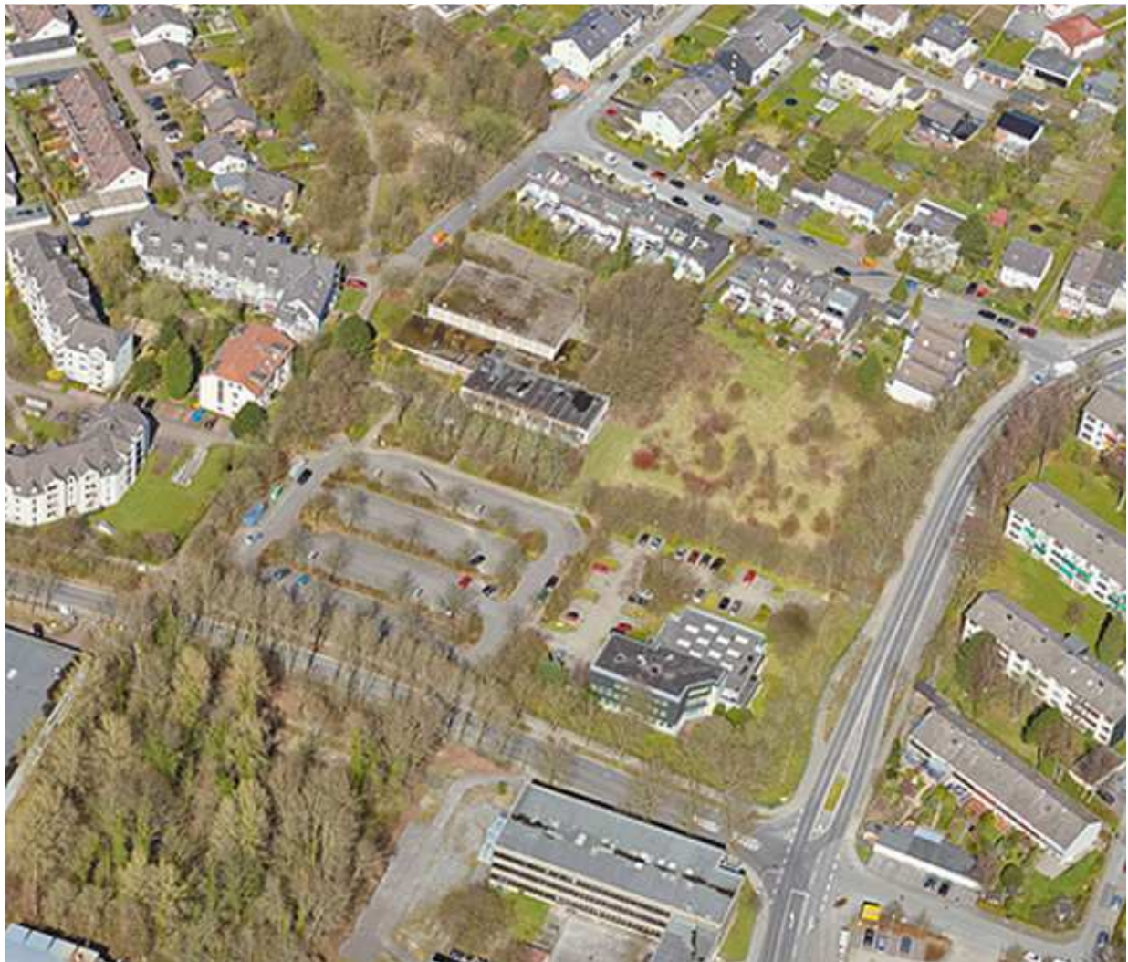
Abbildung 2: Luftbild aus dem Jahr 2018

Das Bürgerhausareal liegt in zentrumsnaher Lage in ca. 300 m – 400 m Entfernung zum Nahversorgungszentrum Gruiten entlang der Bahnstraße und gleichzeitig verkehrsgünstig an einer Haupteerschließungsstraße und in nur ca. 400 m Entfernung zum Bahnhof Gruiten. Diagonal gegenüber des Bürgerhausareals befindet sich ein Lebensmittel-Discountmarkt; im Anschluss daran stellt der Thunbuschpark eine Verbindung zum Nahversorgungszentrum und zum Bahnhof her. Die Lage des Plangebiets zwischen dem Thunbuschpark und dem Grünzug Düsseldorf eröffnet darüber hinaus die Möglichkeit zur Weiterentwicklung einer attraktiven, fußläufigen Verbindung vom Ortszentrum und dem Bahnhof bis in das historische Dorf an der Düssel.