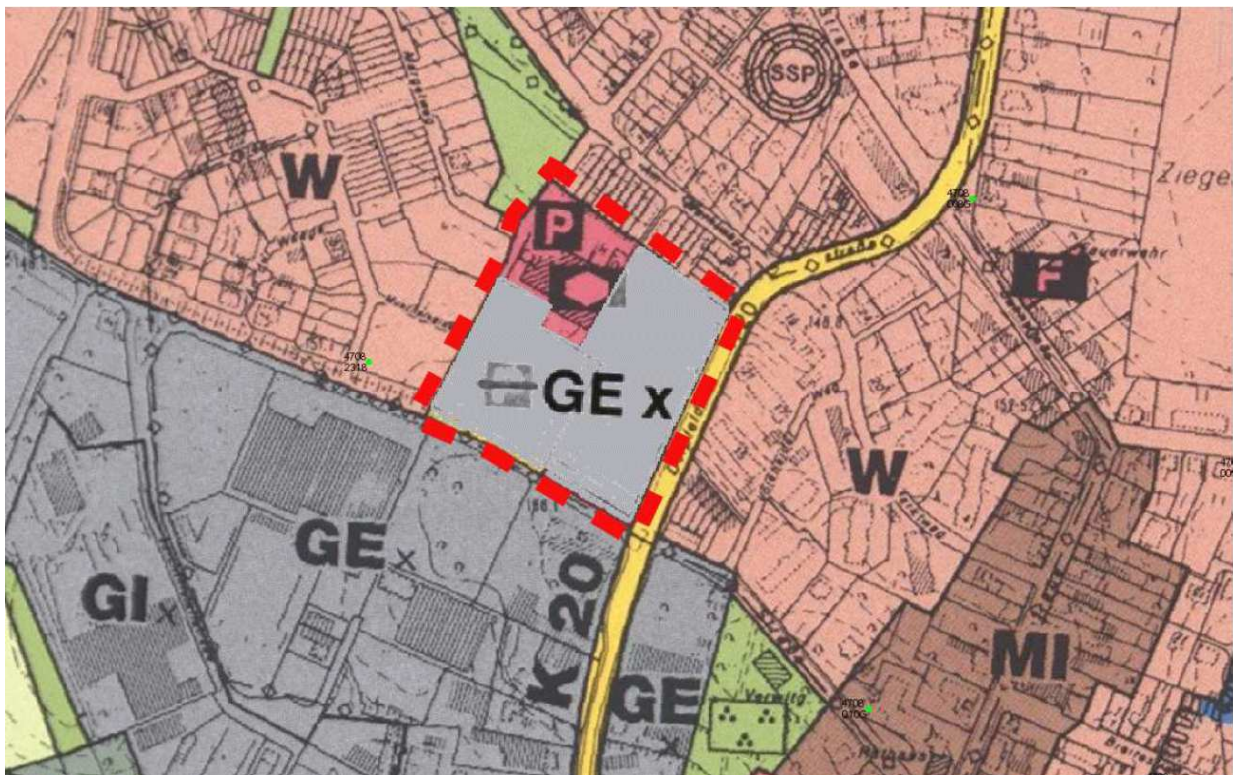
Abbildung 3: Auszug aus dem FNP nach seiner 16. Änderung

Im Flächennutzungsplan (FNP) der Stadt Haan aus dem Jahre 1994 wird der Ortsteil Gruitzen als Siedlungsschwerpunkt dargestellt. Das Grundstück des Bürgerhauses wird als Gemeinbedarfsfläche mit der Zweckbestimmung „sozialen Zwecken dienende Gebäude und Einrichtungen“, die Flächen östlich und südlich hiervon werden im Rahmen der wirksamen 16. FNP-Änderung als nach § 1 (4) BauNVO gegliedertes Gewerbegebiet dargestellt (siehe Abb. 3 ).