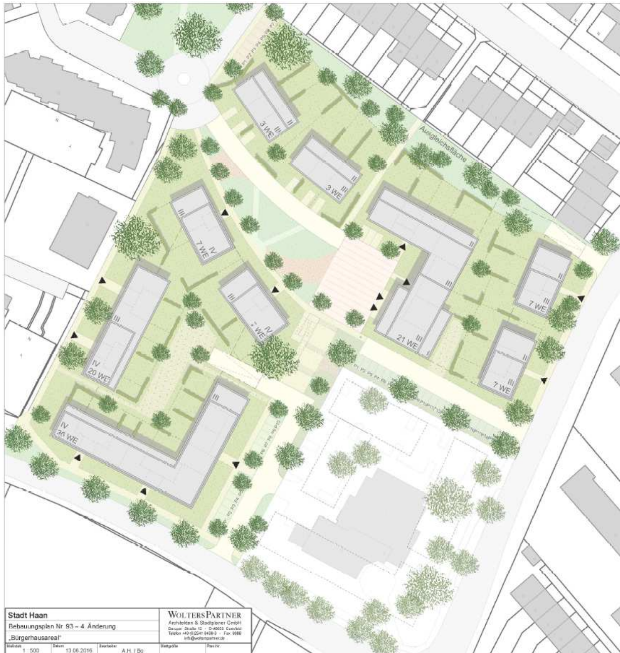
Abbildung 1: Entwurfskonzept des Büros WoltersPartner

Auf der Grundlage der genannten Planungsziele wurde im Mai 2014 ein Workshop mit Studierenden des Lehrstuhls für Städtebau und Landesplanung an der RWTH Aachen durchgeführt. Im Workshop wurden Ideenskizzen zur städtebaulichen Neuordnung des Areals entwickelt und mit der interessierten Bürgerschaft diskutiert. Aus dem Workshop gingen insgesamt 6 Entwurfskonzepte hervor, welche die Verwaltung in der Sitzung des Ausschusses für Stadtplanung, Umwelt und Verkehr (SUVA) am 30.10.2014 vorgestellt hat. Auf Empfehlung der Verwaltung wurde der Entwurf Nr. 1 als Planungsgrundlage beschlossen.