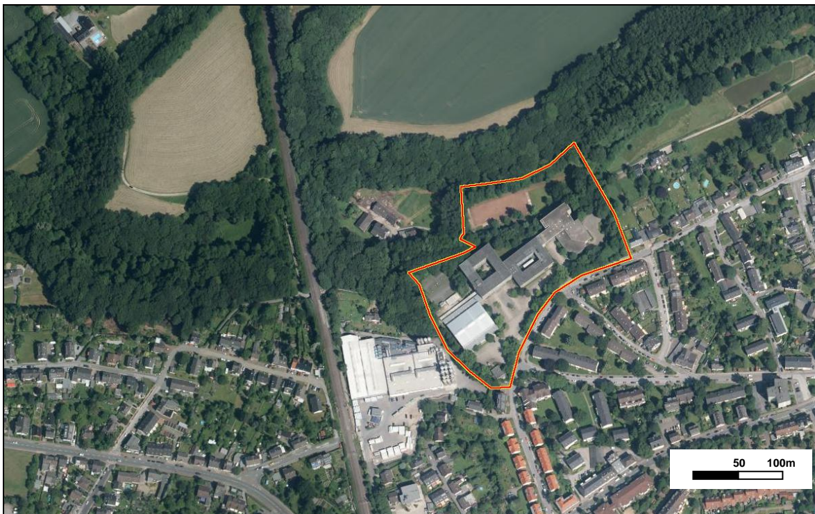
Abb.2: Mit der 2. Änderung geplanter Geltungsbereich des B-Plans Nr. 7 (—)