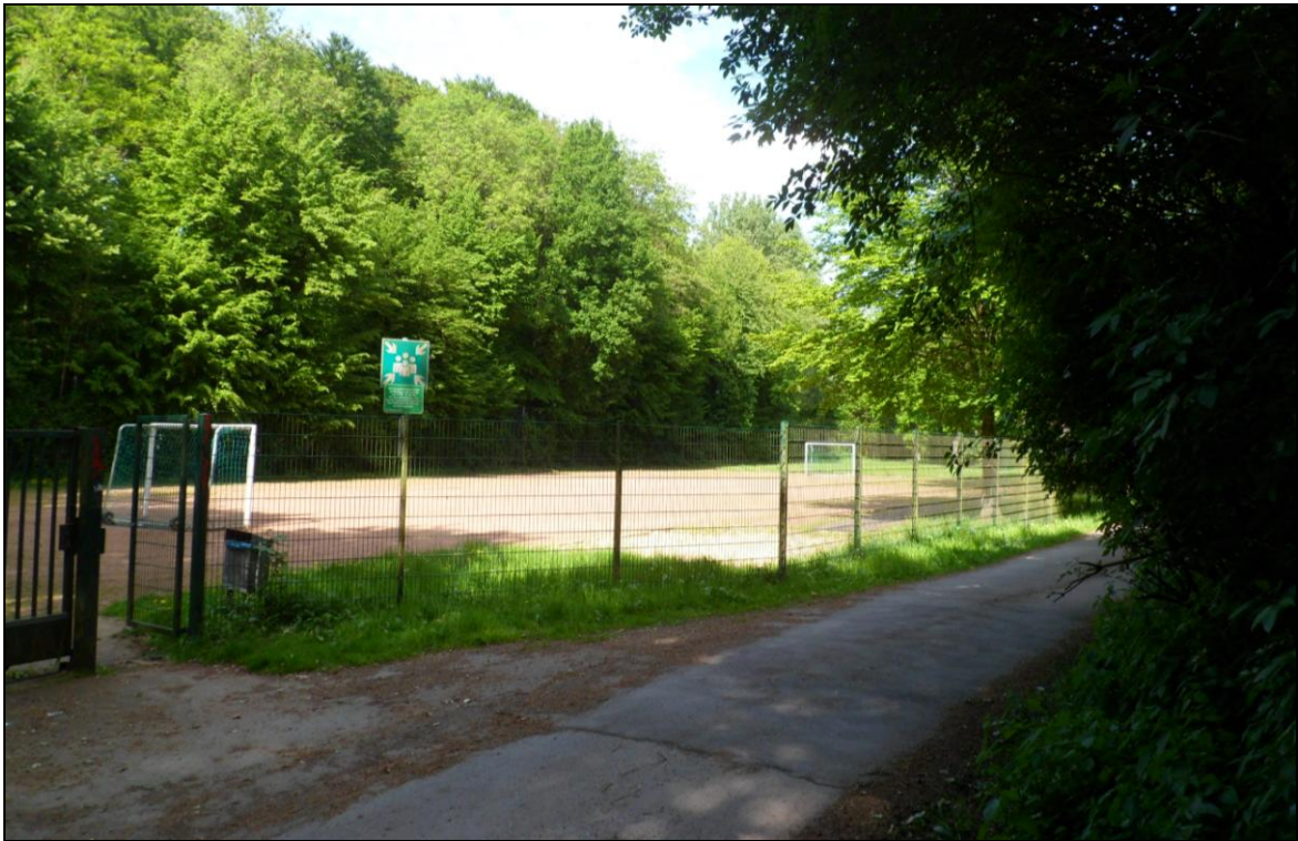
Abb. 3: Blick auf den Sportplatz bzw. die Außenanlage