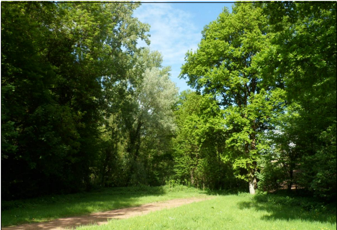
Abb. 4: Blick auf den Ostteil der Außenanlage