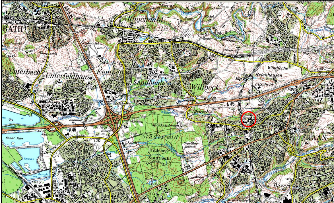
Abb. 1: Lage des Plangebietes

Im Rahmen der Begehung (s. Kap. 3) konnten – bei fortgeschrittener Belaubung – in den Gehölzen des Plangebietes oder dem Baumbestand im unmittelbaren Umfeld des Plangebiets keine größeren Nester, Horste oder Höhlen ausgemacht werden. Totholz, v. a. liegendes, ist zumindest im relativ tief eingeschnittenen Bachtal vorhanden.