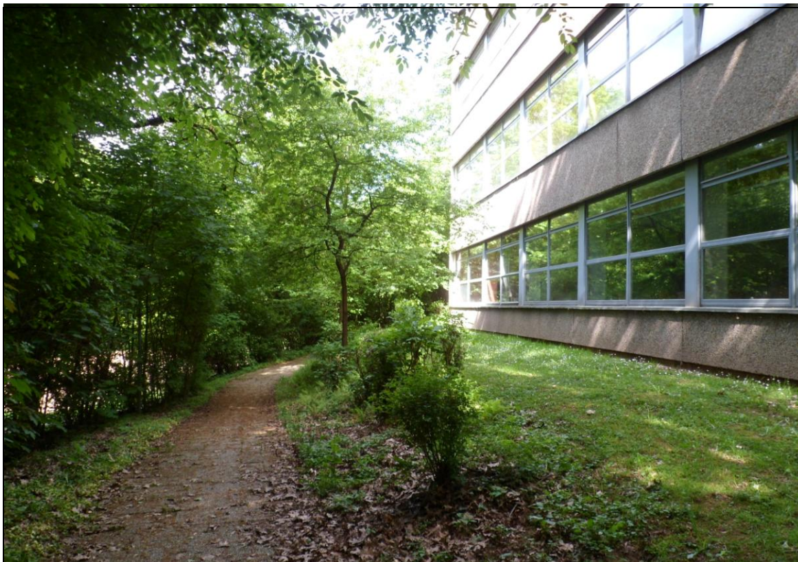
Abb. 5: Bereich zwischen der Nordseite des Schulgebäudes und dem Fahrweg „Horstmannsmühle“ (hier nicht zu sehen)