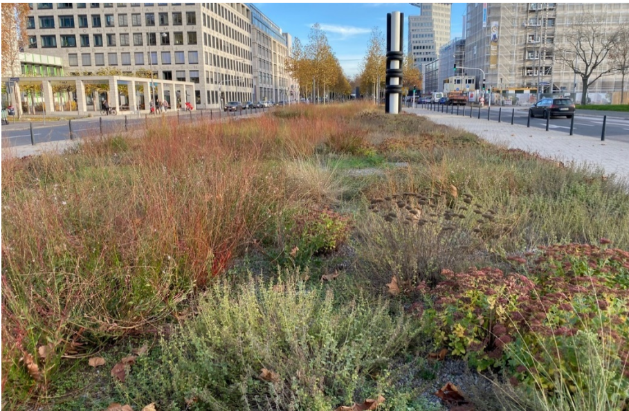
Beispiel einer eingewachsenen Staudenfläche mit Schottermulch

Staudenpflanzungen in kiesige und schottrige Substrate mit einer mineralischen Mulchabdeckung werden aufgrund ihrer Dauerhaftigkeit, des verringerten Pflegeaufwands und des hohen Biodiversitätswertes zunehmend in Verkehrsflächen und Sickerflächen eingebaut.