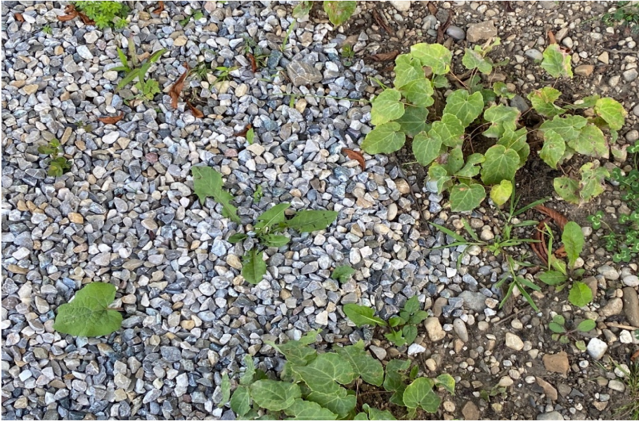
Beispiel Abdeckung einer Pflanzfläche mit Schottermulch

Mineralischer Mulch aus Schotter oder Splitt hat diese Nachteile nicht und sorgt für einen dauerhaften Schutz der Stauden und Gräser, die sich mit einer Mineralischen Mulch wesentlich besser entwickeln. Mit einer Mulchschicht aus Splitt oder Schotter trocknet der Boden weniger aus, wird vor Verdichtung geschützt und verringert den Bewuchs mit Unkraut. Der Einbau eines Vlieses ist nicht notwendig und auch nur bedingt möglich, da die Flächen relativ dicht mit Stauden bepflanzt sind. Ziel dieser Pflanzungen ist eine fast vollständige Bedeckung des Bodens mit den Pflanzen innerhalb weniger Jahre. Dann ist die Mulchschicht auch nur noch stellenweise oder temporär in den Wintermonaten sichtbar.