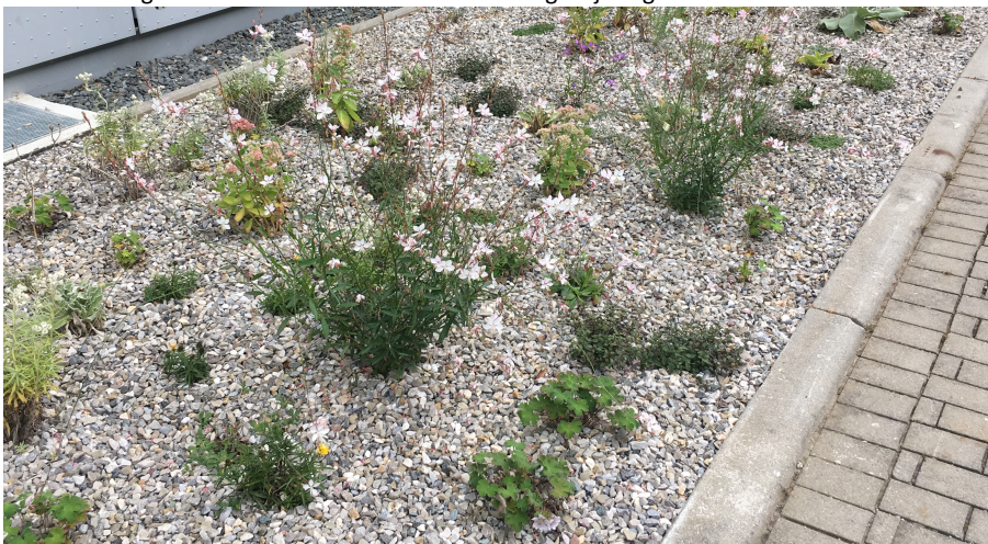
Beispiel Staudenpflanzung in 30cm Kies 0/32mm, abgedeckt mit Kalkschotter 16/32mm

In den vergangenen Jahren wurden von vielen Gartenämtern und Hochschulen sehr erfolgreiche Untersuchungen zur Pflanzung von Stauden und Gräsern in mineralische Substrate aus Kiesen und Schotter durchgeführt. Durch eine Pflanzung von geeigneten Stauden und Gräsern, die durch die kiesigen Unterbodensubstrate in die tieferliegenden Bodenschichten wurzeln, sind diese Pflanzungen wesentlich unempfindlicher gegen Trockenheit und damit besser für sonnenexponierte Lagen geeignet als reine Oberbodenpflanzungen. Auch bei stark beanspruchten Staudenflächen wie zum Beispiel in Schulen ist der Anwuchserfolg in mineralischen Substraten meist besser als bei reinem Oberboden, der durch Betreten wesentlich stärker verdichtet wird. Es gibt außerdem eine große Anzahl an heimischen Ruderalpflanzen wie z.B. die Königskerze oder die Wegwarte, die sehr gut in mineralischen Substraten wachsen und wichtige Blüten- und Nahrungspflanzen für zahlreiche Insekten sind. Durch eine geschickte Artenauswahl können fast ganzjährige Blühzeiten erreicht werden.