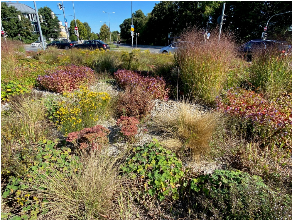
Beispiel Verkehrsinsel in München-Gern

Alle 3 genannten Themen der Gartengestaltung sind unverzichtbare Elemente in der Landschaftsarchitektur, die auf dem ersten Blick den Schottergärten sehr ähnlich sind.