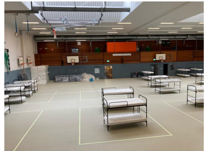
Notunterkunft Sporthalle Adlerstraße