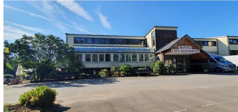
Hotel (vorübergehende Unterbringung)