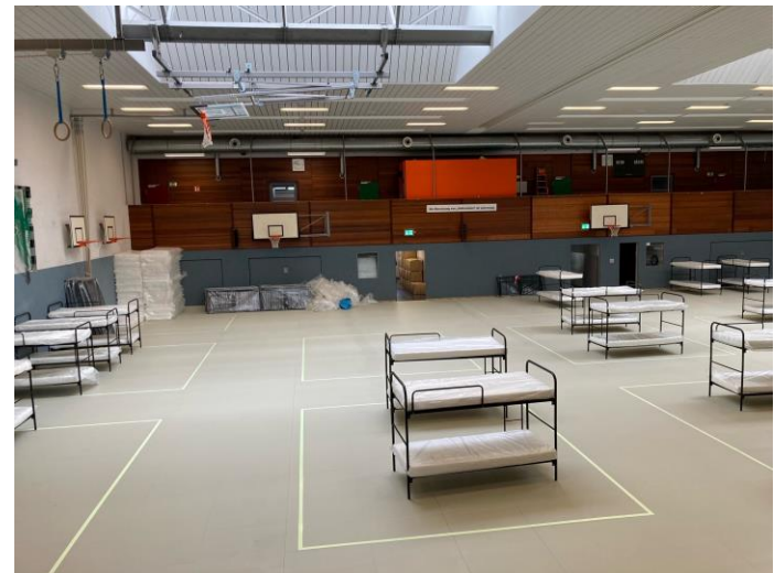
Notunterkunft Sporthalle Adlerstraße