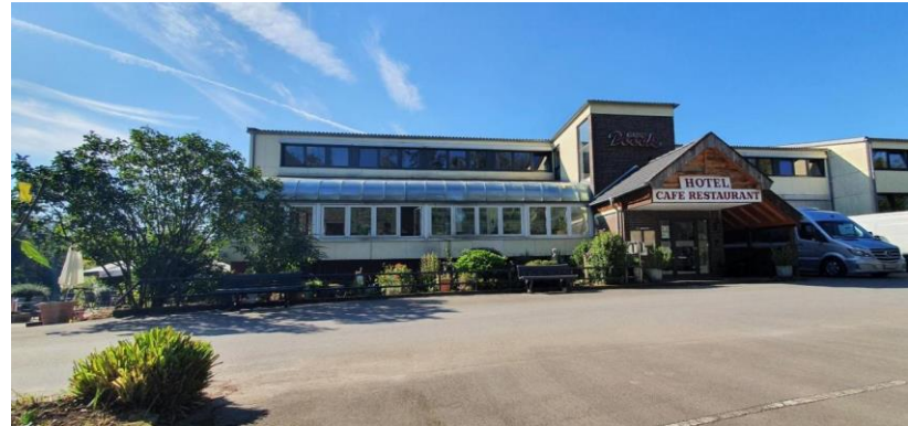
Hotel (vorübergehende Unterbringung)