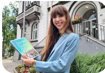
Die Gartenstadt Haan in „Zukunftsbilder 2045“