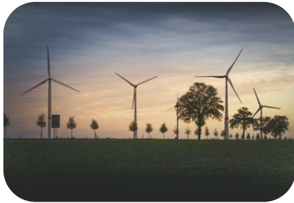
Integrierte Energieplanung und Wärmeplanung