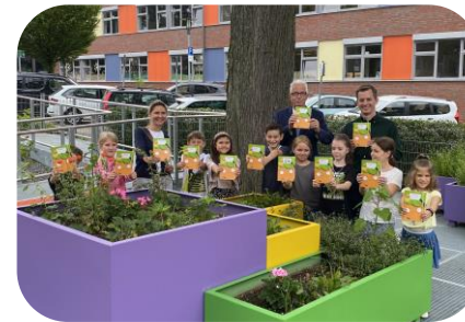
Möhrenheft-Übergabe an der GS Mittelhaan mit dem Landrat