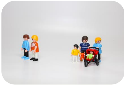
Fußverkehrscheck für junge Familien mit Kindern am 19.09.