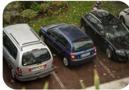
Aufwertung der P+R Parkplätze mit der Autobahn GmbH