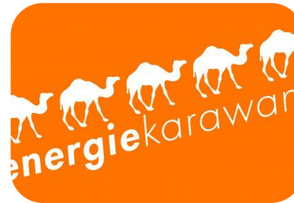
Workshop zur "Energiekarawane" des Klima-Bündnisses