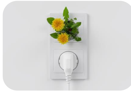
Förderprogramm Stecker- PV geht in die zweite Runde