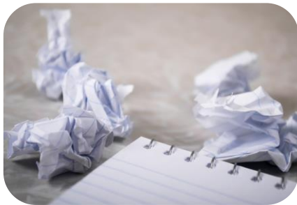
Antragstellung für KfW 432 und BAFA-Energieberatung