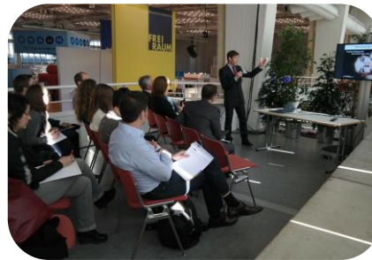
ALTBAUNEU-Vortragsreihe "Wärmewende im Altbau"