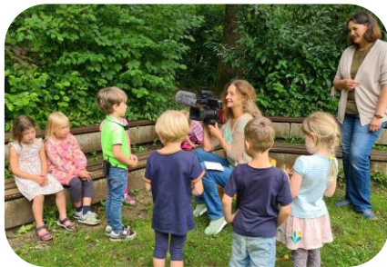
Alle guten Dinge sind drei bei unserer Kindermeilen-Kampagne