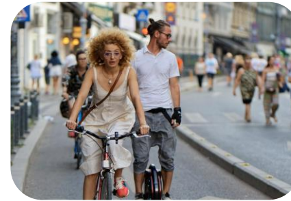
Modal Split Erhebung in der Innenstadt im September