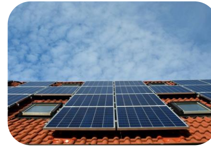
Erfolgreicher Start der Bürgersolarberatung