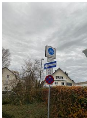
Beschilderung Fahrradstraße Diekermühlenstr.