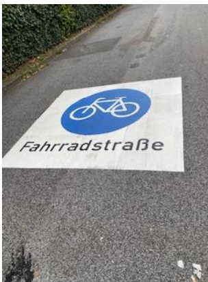
Piktogramm auf der Straße Am Ideck

mit der überarbeiteten Verwaltungsvorschrift zur Straßenverkehrs-Ordnung (Fassung vom 8. 11.2021) wurden die Hürden für die Einführung von Fahrradstraßen gesenkt. In Haan wurden inzwischen drei Fahrradstraßen (Am Ideck, Diekerstraße, Diekermühlenstr.) eingerichtet. Für die auf diesen Straßen geltenden Regeln gibt es häufig noch Erklärungsbedarf. Auch Autofahrer wissen häufig nicht, wie sie sich richtig auf einer Fahrradstraße verhalten.